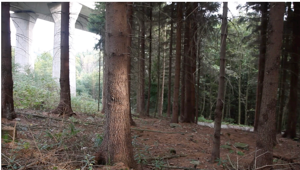
Michaela Thelenová – Bijeli šum za Krásný Les/White Noise for Krásný Les, 2014